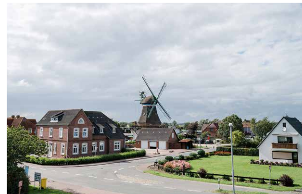
Halbinsel Nordstrand (Süderhafen) ± 25,0 km