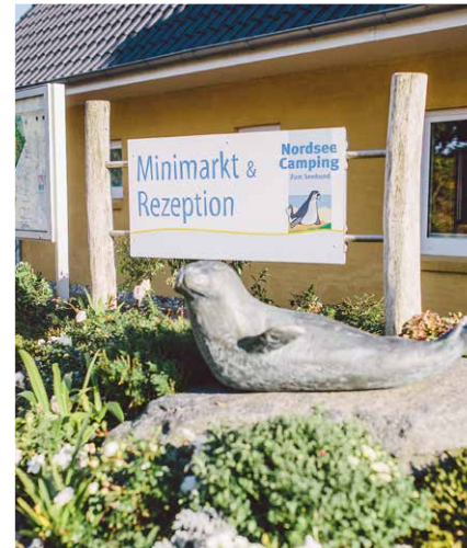
Startpunkt Nordseecamping Starting Point

Wobbenbüll. On the way, around the Husum Bay, you will pass the old town of Husum, cross the Husum Mühlenau, past the outer harbour. When you arrive in Wobbebüll, you can expect to see typical thatched houses and gardens surrounded by stone walls. The route continues via the 4 km long Nordstrander Damm to the Nordstrand peninsula.