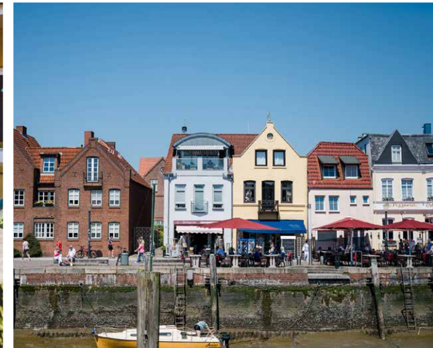
Husum ± 7,0 km