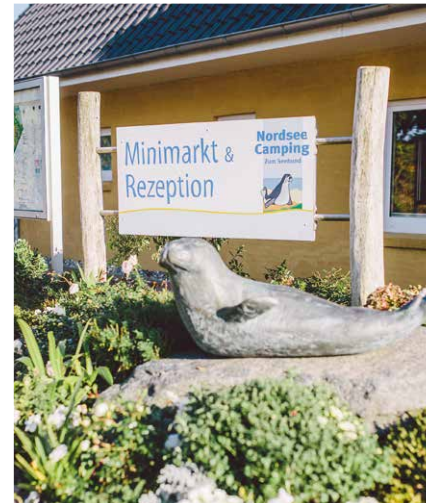
Startpunkt Nordseecamping Starting Point

idyllic marshland in a north-easterly direction. The relatively short and easy route leads you to Husum's historic old town. Whether it is a fish restaurant, old North Frisian gabled houses with colourful facades, narrow streets and cobbled alleys, water or mudflats... Old and modern are harmoniously combined, so there is something for everyone to see.