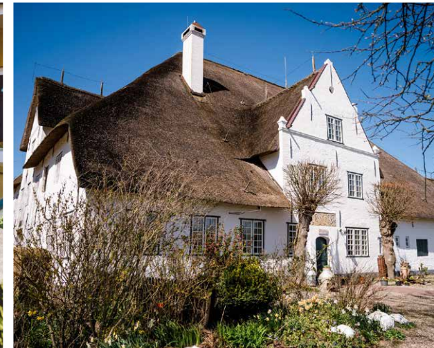
Roter Haubarg ± 9,0 km